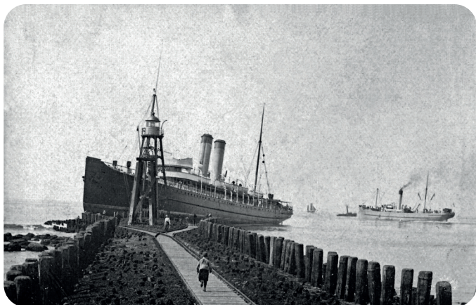
Matige kwaliteit foto. Het schip rechts is de CLACTON

Op die 22e augustus ging het echter mis en omstreeks 05:00 liep de AMSTERDAM op de kop van de pier. Gelukkig was de zee erg kalm zodat er geen gevaar bestond voor de opvarenden. De passagiers en hun bagage werden afgehaald door de reddingboot PRESIDENT VAN HEEL en door de CLACTON, een vrachtboot van de GER. Nadat zij in Hoek van Holland waren geland konden de internationale treinen met een paar uur vertraging alsnog vertrekken.